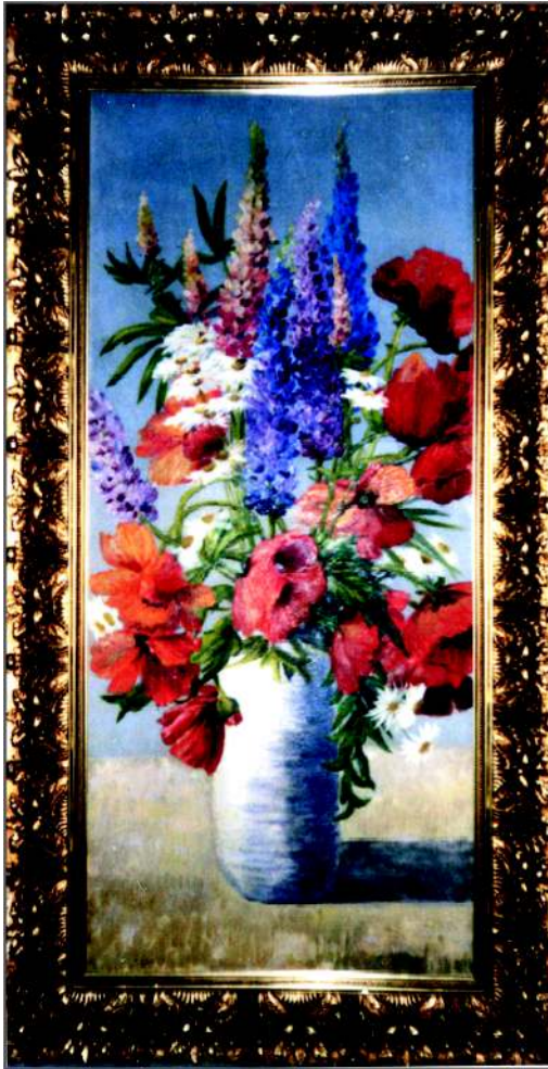
Lupinen mit Mohn Öl