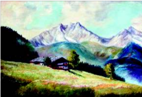
Alpen mit Hütte Öl