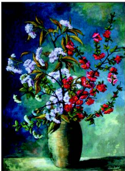
Japanische Kirsche und japanische Quitte Öl 1966