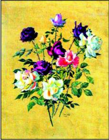
Rosen Öl 1966