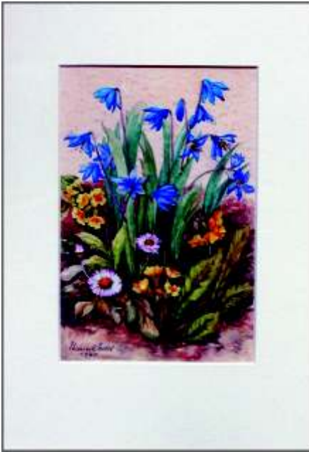
Wiese mit Zilla, Gänseblümchen und Himmelschlüsselblumen Aquarell 1960