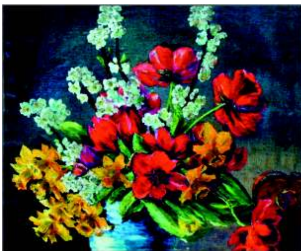
Tulpen, Kirschen und Narzissen Öl ca 72/73