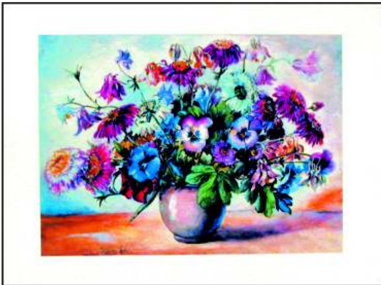
Vase mit Margariten und Stiefmütterchen Aquarell ca 1960