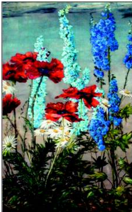
Wiesenstück mit Mohnblumen, Rittersporn und Margariten Öl ca. 1986