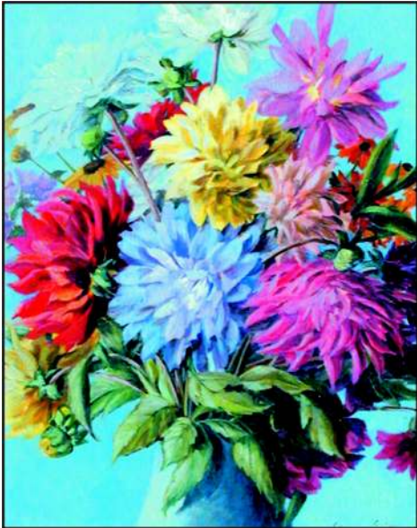
Dahlien Öl 1964