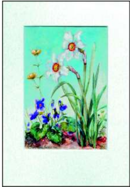
Narzissen und Veilchen Aquarell 1960