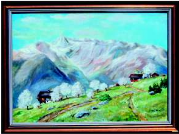
Berglandschaft Vanduser Steinwand mit der Linba Vorarlberg - oberhalb Schrunz Öl