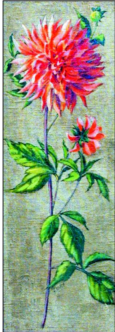
Dahlie Lore Öl